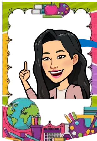
Historia y Geografía